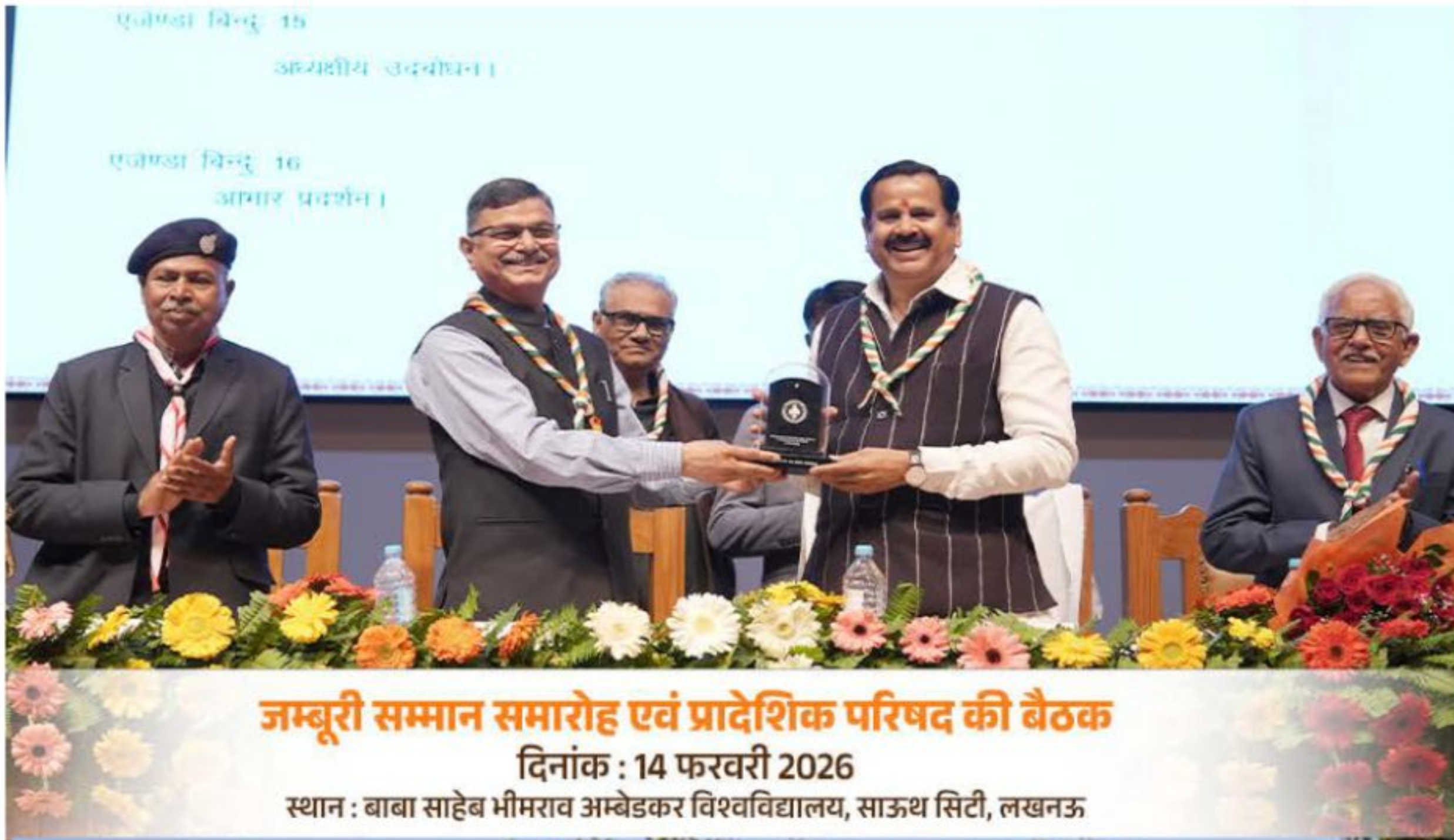
जम्बूरी सम्मान समारोह एवं प्रादेशिक परिषद की बैठक दिनांक : 14 फरवरी 2026 स्थान : बाबा साहेब भीमराव अम्बेडकर विश्वविद्यालय, साऊथ सिटी, लखनऊ